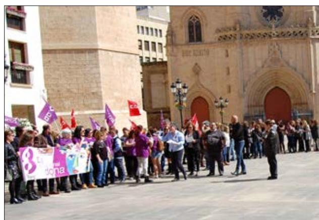
Vaga de dones a la plaça Major