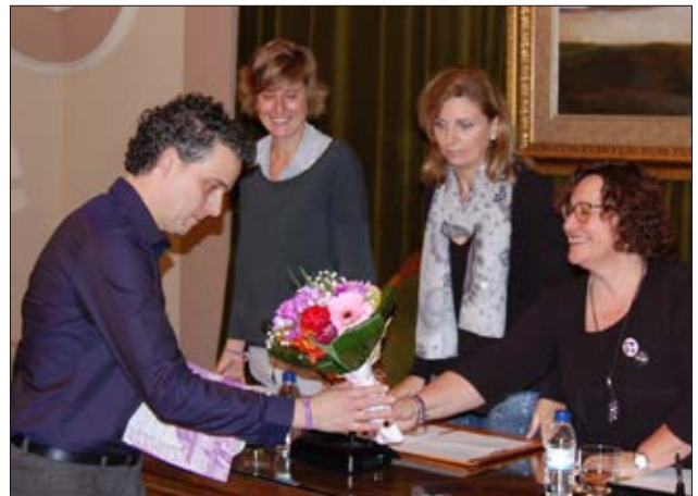
Premi d'Investigació Històrica de les Dones a Castelló 2017

El Dia Internacional de les Dones és una data assenyalada a l'agenda de Castelló amb una programació molt variada