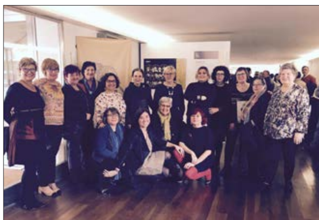
Adona't en la inauguració de la exposició LITE-RATES. Mamíferes de la cultura