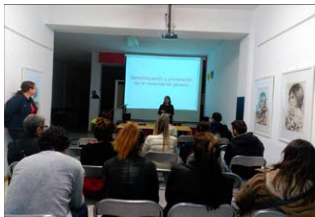
La Flama organitzà una xerrada sobre violència de gènere