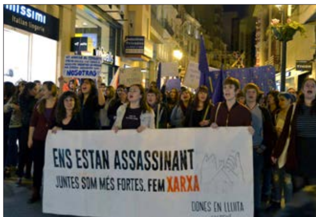
Dones en Lluita en la Manifestació del 8 de Març