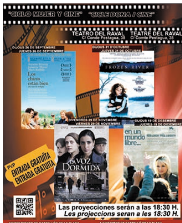
Imatge del cartel del cicle Dona i Cine