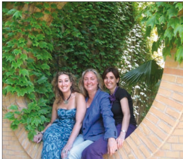
Les coordinadores de la Fundació Isonomia

En 2007 l'Ajuntament va aprovar el seu I Pla d'Igualtat i després de la seua finalització, en 2011, es va obrir un període d'avaluació del document i preparació del II Pla Municipal d'Igualtat d'Oportunitats entre dones i homes de Castelló. La Fundació Isonomia, junt amb altres entitats locals, ha participat activament en aquest procés, integrant, en qualitat d'entitat experta en matèria d'igualtat, la Comissió Assessora. L'objectiu últim d'aquest treball conjunt ha