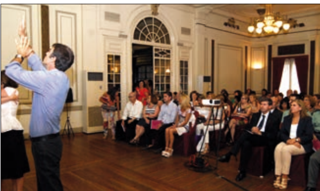
Un momento de la representación