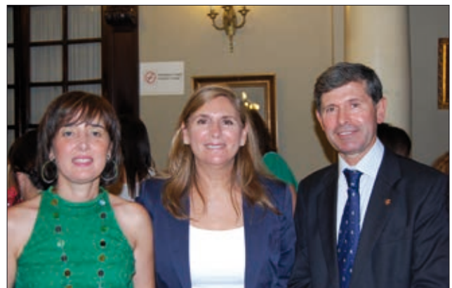
Concejala, alcalde y la trabajadora social del SIO