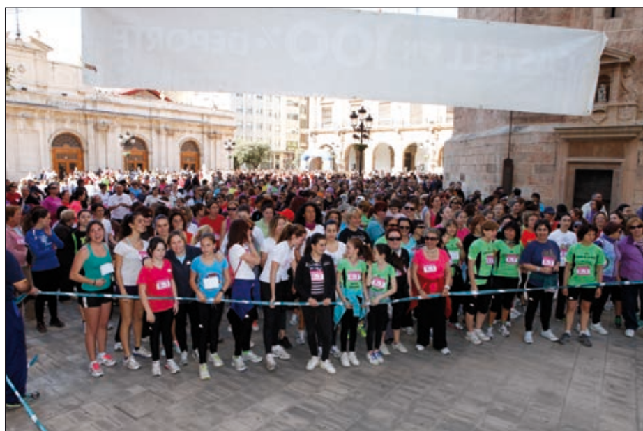
Imatge d'un moment abans de l'inici de la Cursa 2013

El circuit urbà va discórrer per plaça Major – Colon – carrer Major – plaça Maria Agustina – Comte Pestagua – Clavé – Arrufat Alonso – Ronda Magdalena – plaça de la Independència (La Farola) – Passeig Ribalta (imparells) – República Argentina – Navarra – plaça del Real – Porta del Sol – Falcó – plaça de la Pau – Major – Arxipreste Balaguer i arribada a meta en la plaça Major. Les dones participants van lluir un dorsal amb el mateix número, el "8o3", com a referència al 8 de Març i van obtindre com a obsequi una camiseteta commemorativa a l'entregar el dorsal.