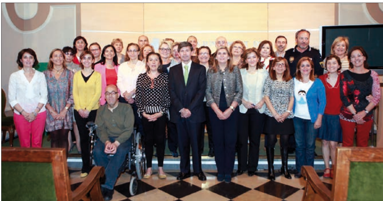
El alcalde de Castellón y la concejala de Igualdad con representantes de las comisiones Técnica y Asesora durante la rueda de prensa del Plan

■ El documento, elaborado desde la metodología participativa, se estructura en seis áreas que recogen un total de 155 medidas de actuación