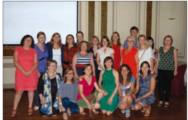
La compañía teatral junto a técnicas municipales y concejalas del Ayuntamiento