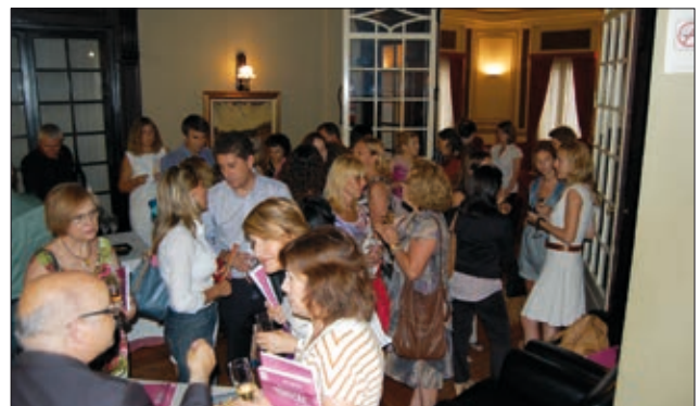
Las personas asistentes recibieron un ejemplar del PIO