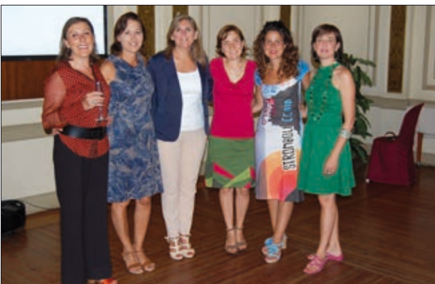
El equipo del SIO con la concejala de Igualdad