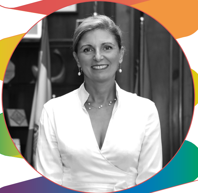
Amparo Marco Gual Alcaldeessa de Castelló

"A través d'aquest document, l'Ajuntament de Castelló incorpora la perspectiva de la diversitat sexual i de gènere de manera transversal en totes les accions municipals."